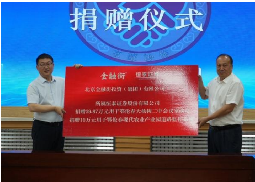
鄂倫春自治旗捐贈儀式