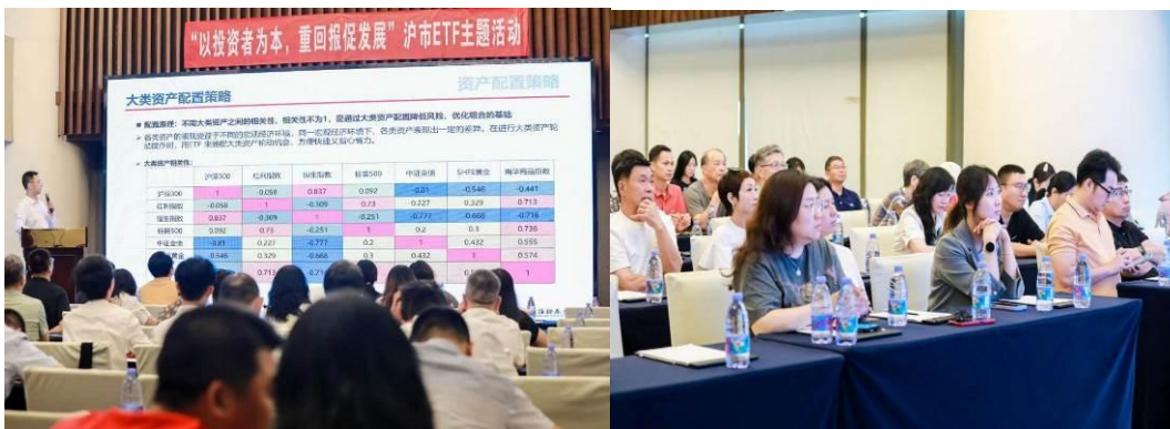
聯合上交所走進城市廣場，增顯ETF普惠性