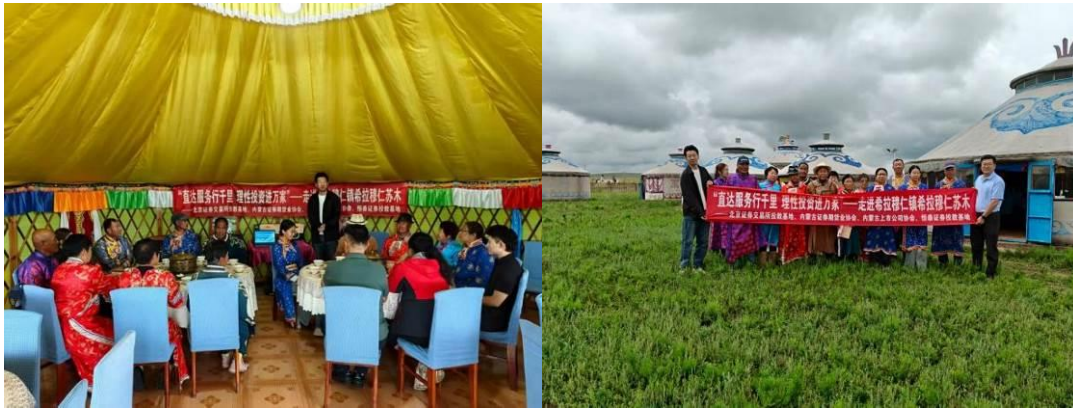
攜手上海證券交易所，舉辦“以投資者為本，重回報促發展”滬市ETF主題活動專場培訓