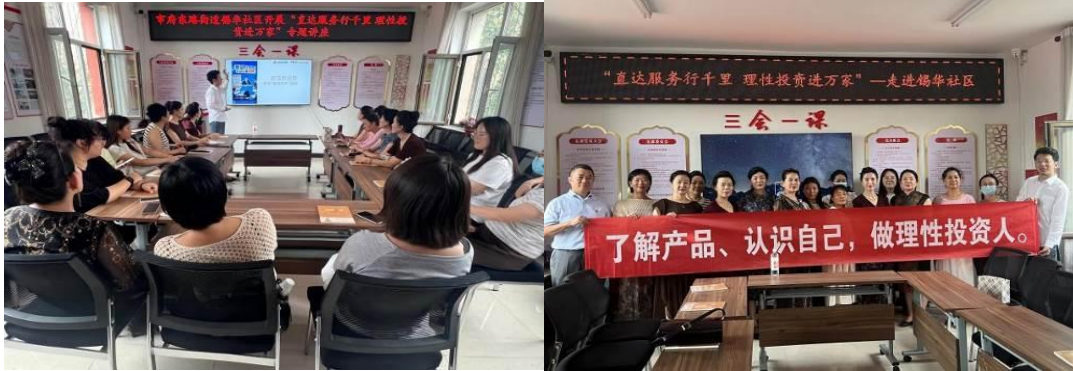
牧區行動：服務直達草原深處