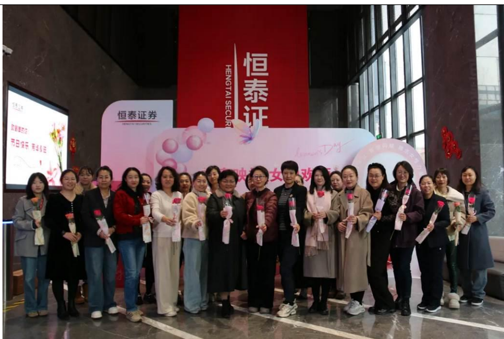
國際婦女節活動照片

2025年5月-6月舉辦全員雲上運動會，並在6月28日策劃舉辦“恒擎山海 泰破風雲”勇士障礙賽活動，激發員工健康活力，凝聚團隊奮進力量，打造一場“熱血與溫暖並存”的運動盛宴。