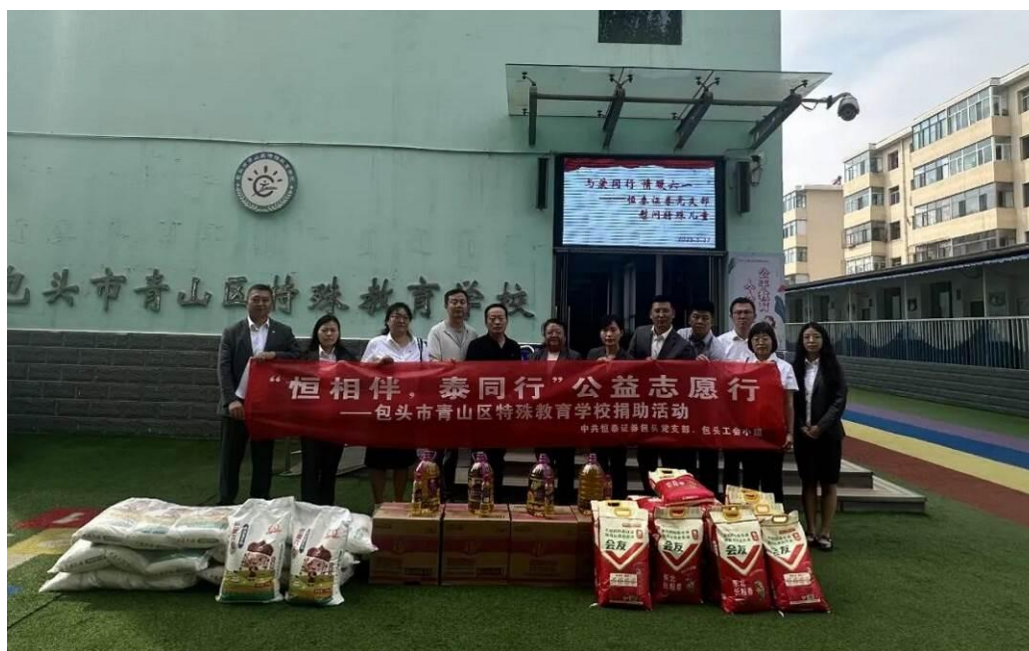
包頭市青山區特殊教育學校捐贈

本公司積極踐行社會責任，指導各工會小組開展各類社會公益活動。本公司於 2025 年 5 月 27 日走進包頭市青山區特殊教育學校，開展公益志願行主題捐助活動，為孩子們送上節日祝福與暖心物資，並通過參觀交流為特殊兒童營造充滿關愛的社會環境。在呼和浩特石人灣開展守護濕地捐贈活動，為當地生物多樣性保護提供助力。