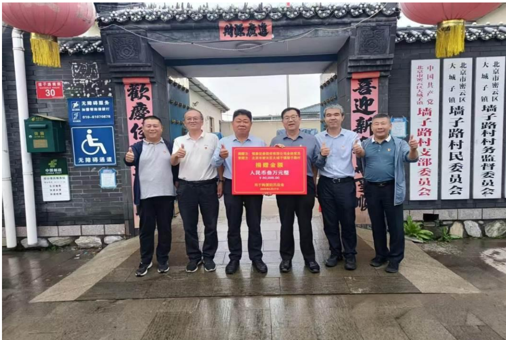
北京市密雲區防汛救災捐款