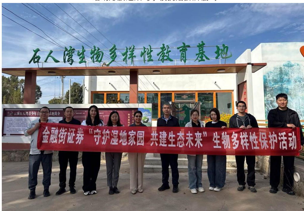
石人灣生物多樣性保護活動