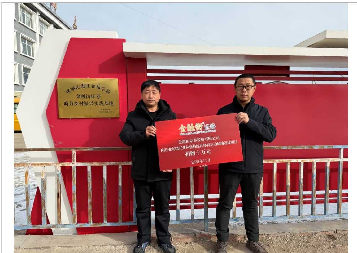
喀喇沁旗旺業甸學校捐贈掛牌儀式