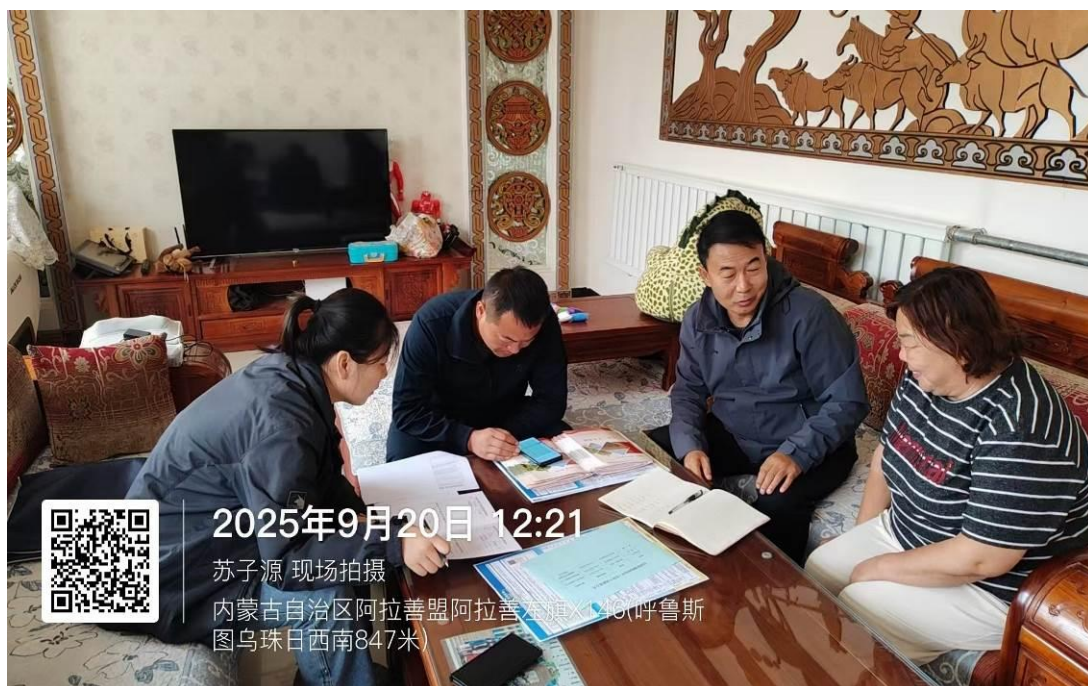
駐村幹部開展入戶走訪工作