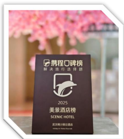
攜程集團頒發 2025 武漢美景酒店榜