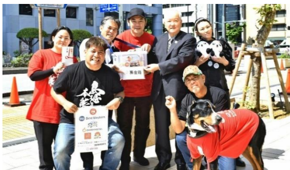
日本沖繩慈善步行籌款活動