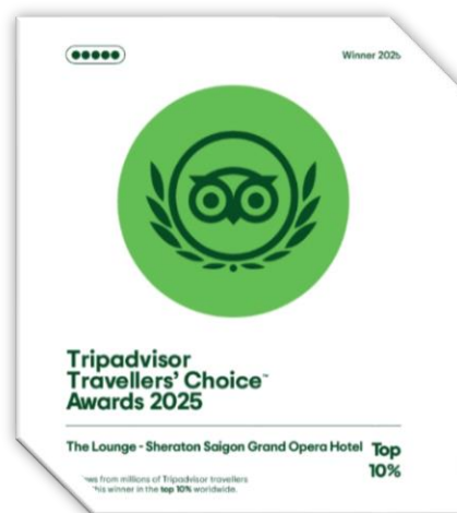
貓途鷹 2025 年旅行者之選獎