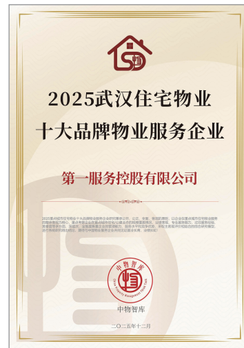
2025武漢住宅物業十大品牌物業服務企業