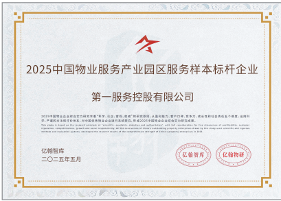
2025中國物業服務產業園區服務樣本標竿企業