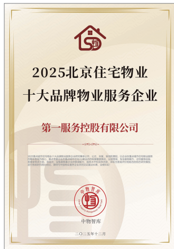
2025北京住宅物業十大品牌物業服務企業