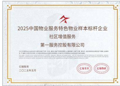
2025中國物業服務特色物業樣本標竿企業 — 社區增值服務