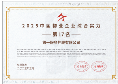
2025中國物業企業綜合實力TOP17