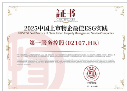
2025中國上市物企最佳ESG實踐