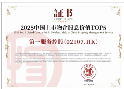
2025中國上市物企股利價值TOP5