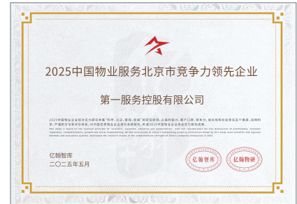
2025中國物業服務北京市競爭力領先企業