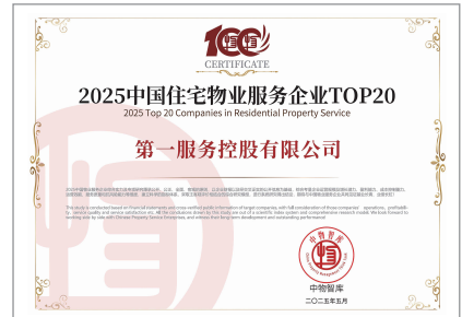
2025中國住宅物業服務企業TOP20