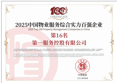
2025中國物業服務綜合實力百強企業TOP16