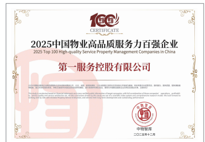
2025中國物業高品質服務力百強企業