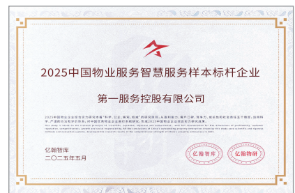
2025中國物業服務智慧服務樣本標竿企業