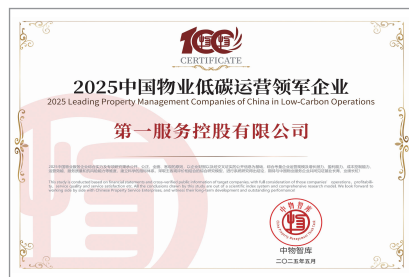
2025中國物業低碳運營領軍企業