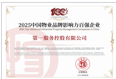
2025中國物業品牌影響力百強企業